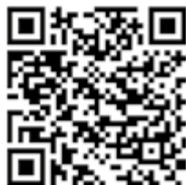
QR-Code für Tierfund-Kataster-App (Android)